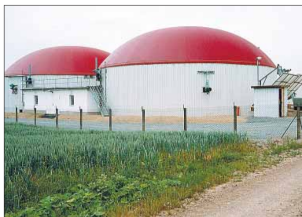
Oben links: Ein winziges Wasserkraftwerk – doch das Prinzip ist gut zu erkennen: Bach, Staumauer, Wasserrad, Generator-Häuschen und Stromkabel. Oben rechts: Moderne Windräder zur Stromgewinnung, genannt „Spargel“ – vor allem in Norddeutschland gibt es inzwischen tausende dieser Anlagen wie hier im Kreis Stormarn. Unten links: Solarplatten auf einem Hausdach. Unten rechts: Eine Biogasanlage. Die beiden großen Behälter nennt man auch „Fermenter“.